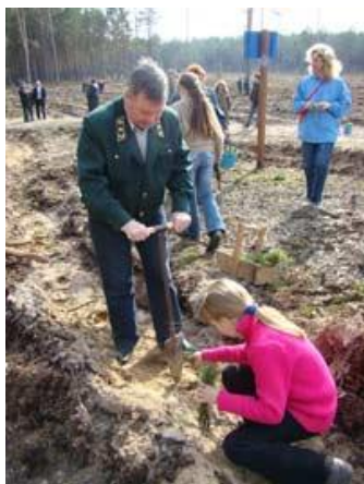
Рисунок 1 –Выполнение работ по созданию лесных культур

Оформление рисунков, схем, фотоматериалов обозначают словом «Рисунок», его располагают внизу под схемой, фотографией или рисунком, непосредственно после ссылки в тексте. Нумерация для таблиц, рисунков и фотографий должна быть сквозной.